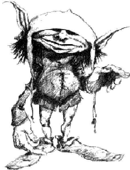
Representació gràfica d'un follet.

Dels follets se n'ha arribat a dir moltes coses dolentes, i per això la majoria de la gent els hi ha agafat angúnia i temor. En això, com en altres ocasions, hi ha tingut molt a veure la religió cristiana. La transformació dels déus familiars, protectors i responsables, en follets entremaliats i murrís, es remunta al segle V després de Crist, amb la caiguda de L'imperi Romà d'Occident ( 476 aC.). La persecució de la religió mitològica i la voluntat d'instaurar el cristianisme com a religió oficial de l'Imperi va fer transformar molts dels antics herois i divinitats en éssers malvats i ferotges.