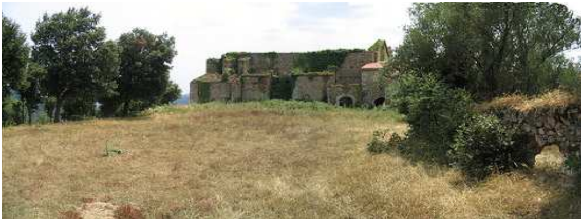
Vista del convent de Sant Salvi, actualment en ruïnes. La imaginació popular situa, tot sovint, diverses llegendes en aquest indret.

Cal destacar que una gran nombre de testimonis, sovint els de més avançada edat, es neguen rotundament a narrar les seves vivències relacionades amb la por , convençuts que aquesta encara continua viva entre nosaltres.