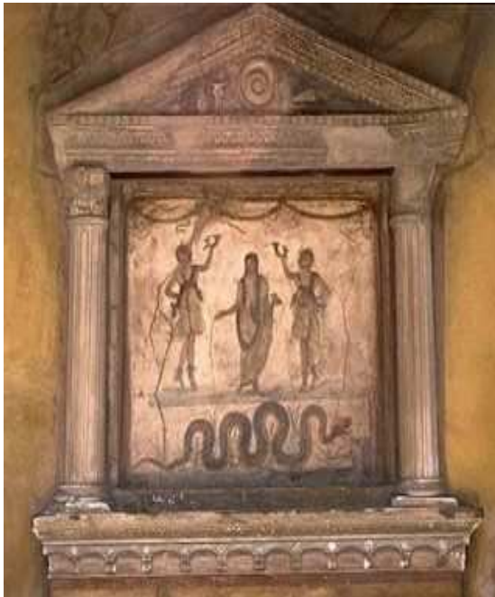
Lararium, conservat en perfectes condicions, de l'antiga ciutat de Pompeia.

Els romans els representaven com a esperits vagues, indefinits, com uns joves alegres, amb signes d'abundància a les mans, i ho realitzaven mitjançant pintures a la paret, amb estàtues de dimensions reduïdes en una fornícula o amb un edicle en forma de temple petit. Aquest espai era anomenat lararium , i és on es retien culte especial, amb ofrenes, els dies especials del mes i els dies d'aniversari, tot i que eren també venerats cada dia en començar la jornada i al principi dels àpats.