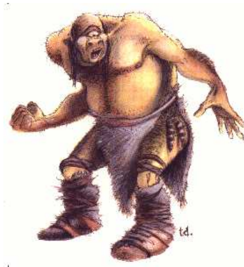
Representació gràfica d'un ciclop.

Es creu que el fet que sigui tan hàbils amb la construcció d'armes pot tenir relació amb el fet que tinguin, només, un sol ull. Els estudiosos pensen que la llegenda del ciclop va sorgir de la pràctica habitual dels ferrers de portar un ull tapat quan elaboraven les peces per tal de no quedar-se cecs dels dos ulls a causa de les flames del foc.