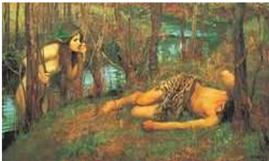
En aquesta pintura, de John William Waterhouse, representació d'unes nàiades descansant a la riba d'un riu.

Vet aquí que fa temps, quan encara els animals parlaven, un vell de barba blanca cobert de llargs cabells, el qual es caracteritzava per la seva santedat, vivia solitari, sempre fent oració, en un racó de la muntanya. Però el que no sabia el bon home, era que amagades entre les tonalitats aquàtiques, vivien, soles com ell, una gran quantitat d'encantades. Un dia, enmig d'una trapelleria, Gualba, la més petita de totes, va apostar que aconseguiria, fos com fos, fer-li perdre la seva santedat. Així va ser com, tota divertida i amb la seva entremaliadura ficada en ment, va córrer a cercar al pobre ancià. Convertida en un ocell daurat, el temptà amb diferents propostes, entre elles obtenir saviesa o enriquir-se escandalosament. Observant que el seu mètode no funcionava i que l'home es resistia a cedir, utilitzà el seu gran poder de seducció per conquerir-lo: deixà l'aparença d'au i es deixà caure totalment nua davant els innocents ulls de l'ermità. Aquest, admirat per la bella silueta de la dona, s'enamorà bojament de Gualba, al qual va desaparèixer quan va aconseguir el seu propòsit. El vell, desesperat, cridà el nom de la seva enamorada per tots els racons de la muntanya. D'altra banda, com que les altres encantades es reien de la situació, s'entretenien a repetir allò que l'ermità pronunciava, i així es creà l'eco.