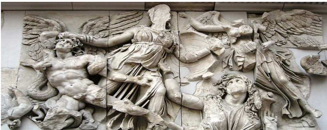
Fris de l'altar de Pèrgam dedicat a Zeus que il·lustra el mite de la gigantomàquia.

Font: Mitologia grega. Déus, homes i monstres, de Michael Gibson