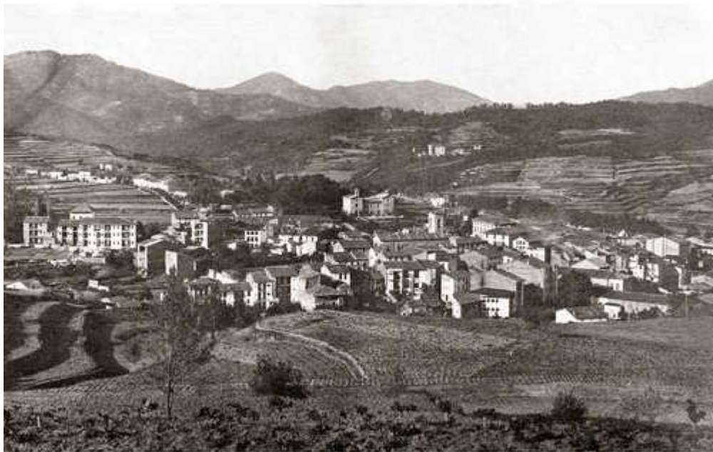
Antiga fotografia de la població de Sant Hilari Sacalm, la capital de les Guilleries.

aquells contes, mites i llegendes que formen part de la nostra història, de la nostra terra. Ara bé, també cal advertir que el problema de la tradició oral és la deformació de les històries amb el pas dels anys. Per tant, no és difícil trobar més d'una versió dins de la mateixa llegenda o conte. Això implica una selecció de les històries, de les quals no tenim la màxima verificació que aquella en sigui l'originària, però sí la més utilitzada. No obstant, encara que l'anàlisi comparativa del treball se centri en una sola versió, no s'exclourà cap història i sempre se citaran les més representatives a cada explicació. Per fer més fàcil la seva identificació dins del text, s'expressaran a partir de dos asteriscs i amb lletra cursiva. La bandera catalana -la senyera-, per altra banda, identifica les llegendes de cada apartat que pertanyen a la cultura popular catalana.